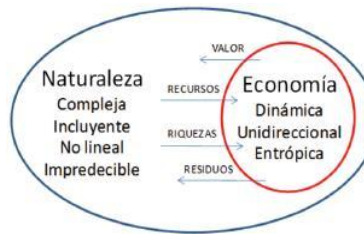
Figura 1. Relaciones del sistema ecológico- económico

Durante años la naturaleza ha provisto a la humanidad de recursos naturales, generando riquezas y a cambio la naturaleza ha recibido residuos. Una economía de crecimiento ilimitado no podrá subsistir con recursos limitados.